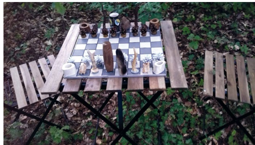
Waldschach · 2019 · Tisch 50 × 50 × 70 cm, 2 Stühle, 32 Schachfiguren

Manchmal kommen Datschenbewohner aus der Nachbarschaft zum Schachspielen. Die Verbindung zwischen Intellekt, Spiel und Kommunikation hat schon viele Künstler – wie z.B. Marcel Duchamp – fasziniert.