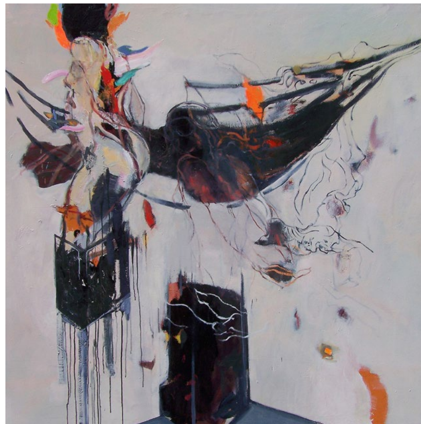
Deathmask · 2017 · Öl auf Leinwand · 143 x 143 cm

Die Performance „ Sweet Delight – Endless Night “ knüpft in poetischer Wendung an diese Rezeptionsambivalenz an.