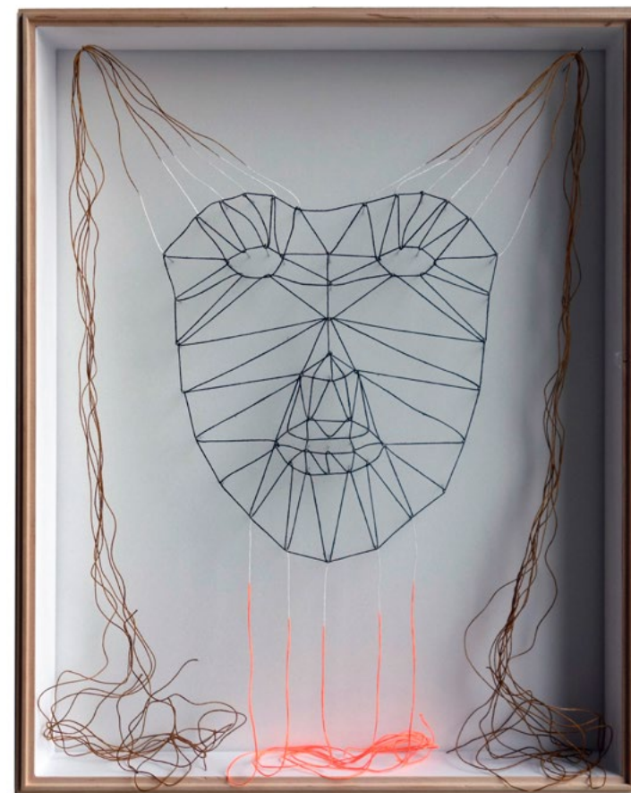
I dressed up several times · 2019 · Garn, Insektennadeln, Tusche · 51 x 42 cm

Die Idee einer Verwandlung bedeutet hier eine Neuinszenierung, ein Spiel mit einer neuen Identität ist möglich. Meine Maske enttarnt sich selbst durch ihre Transparenz und offene Struktur, sowie durch das Material, das sie in ihrer Einfachheit skizziert, schemenhaft und reliefartig wirken lässt. Ihre neu gewonnene Persönlichkeit als weibliches Wesen wirkt nicht mehr bedrohlich, sie hat sich von ihrer ursprünglichen Idee der Überwachung und Kontrolle losgelöst und ihr spielerisches Eigenleben beginnt.