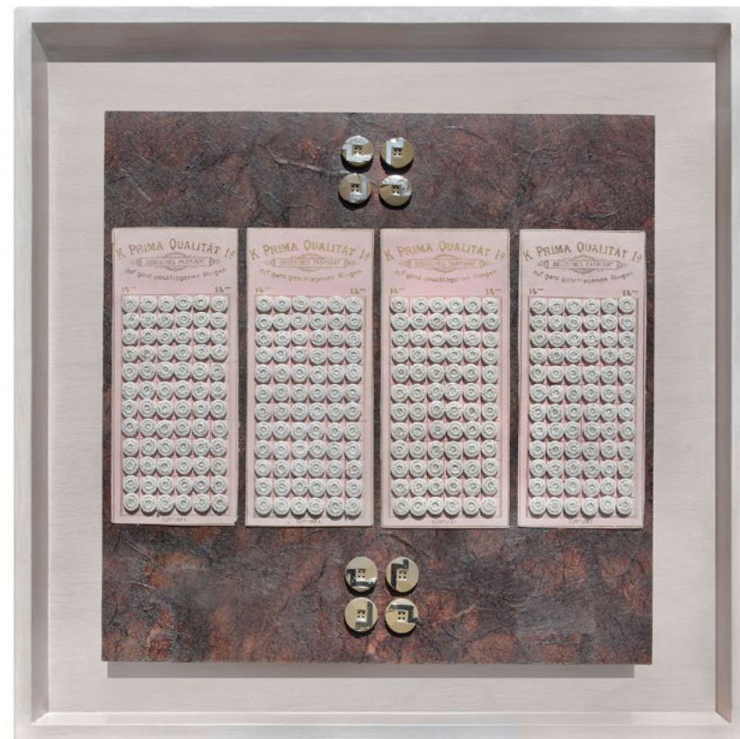
Aus der Serie POLITISCHE PERLEN. FÜR IDA D. · Prima Qualität · Eins A weiße deutsche Wäscheknöpfe auf braunem Grund · Papier, Kunststoff, Textil · Assemblage · 2020 · 40 x 40 cm