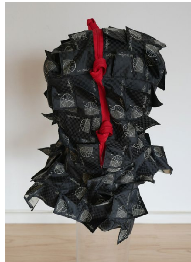
Maske 2020 Baumwolle Einheitsgröße 40 x 25 x 25 cm

Verwandlung schafft Sicherheit – der Preis ist Distanz.