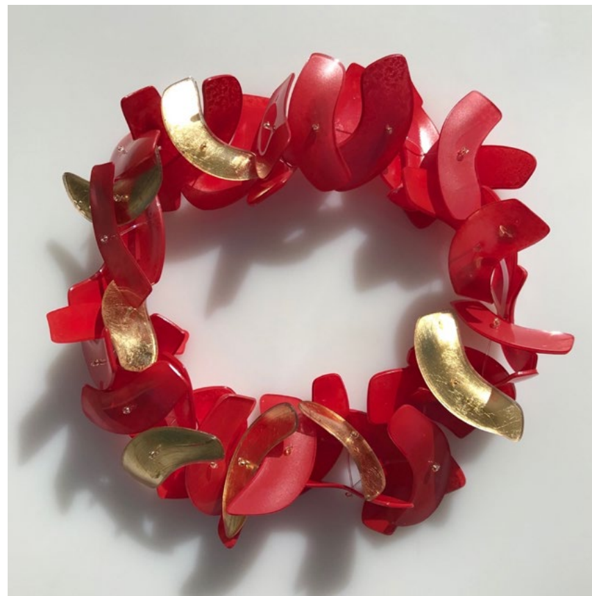
Feuer-Kette · 2019 · Plexiglas, verformt, bemalt, blattvergoldet · ca. 60 × 6 × 6 cm

Begeisterung“. Das ist der Ursprung, der Motor und das Ziel unseres Handels und auch jeden künstlerischen Prozesses. Die Kette habe ich aus transparenten, ausrangierten Brillengläsern gefertigt. Ursprünglich sollten die Gläser dem Nutzer helfen, seine Umgebung scharf zu sehen, deutlicher wahrzunehmen. Nun werden sie im Umkehrschluss selbst zum Objekt der Beobachtung, auf das sich die Blicke fokussieren. Durch thermisches Verformen, Mattieren, Vergolden und Montieren entstand das tragbare Objekt.