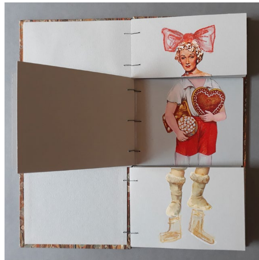
7 Figuren 343 Variationen · 2019 · Büchlein · 21 x 11 cm