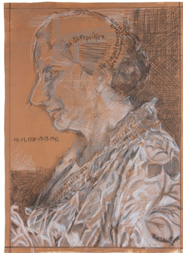
Portrait zu Ida Dehmel 2019 · Pastellkreide auf gefärbten Papier 42 x 30 cm