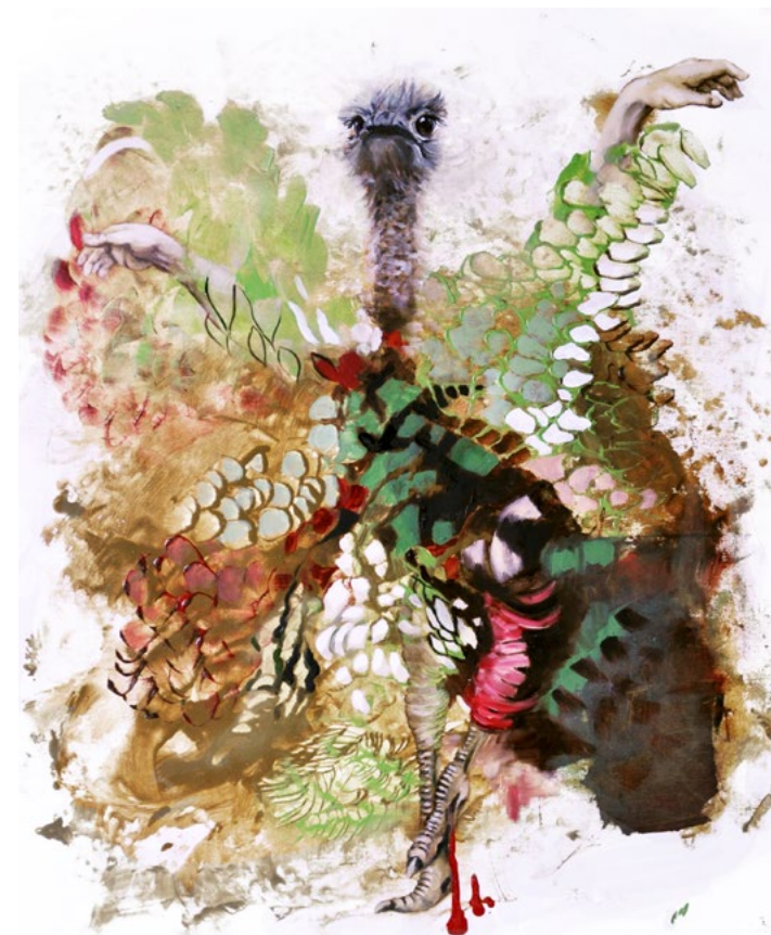
Strutheo · 2012 · Öl auf Leinwand · 59 x 49 cm

tierung und Montage, z.B. in der Serie: Homophyta. Ich stelle Verwandlung und Nachahmung des Körpers in unterschiedlichen Formvarianten zur Diskussion, bei der sich Mensch und Tier vermischen. Die Grenze zur Animalität wird dadurch spielerisch untersucht und deren Unbestimmtheit entlarvt.