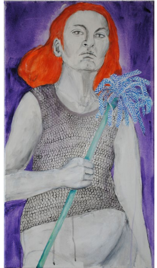
Ritterin (oder Brunnhilde Strafe) 2018 · Acryl/Leinwand 80 x 45 cm

Fliegen fliehen sublimieren träumen spielen. Ich liebe Theater!