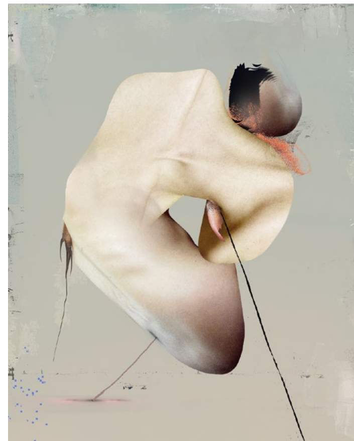
Faltung · 2020 · Digitale Collage, Fineart Print · 60 x 50 cm

Bis zu welchem Grad ist das Rollenspiel noch glaubhaft und authentisch? Fängt Inszenierung nicht schon beim Körperbewusstsein an? Oder sind die verschmolzenen Körperteile nur skulptural geformte Schneiderpuppen, für die die passende Kleiderhülle dringlich erfunden werden muss?