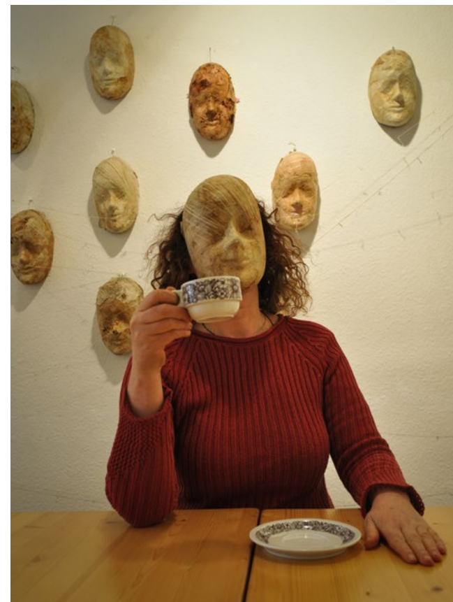
Medea and me 2017 · Papierarbeit/ Kaschiertechnik 80 × 120 cm

betriebs fällt mir schwer bzw. dünkt mir, in Konkurrenz mit meiner künstlerischen Arbeit zu gehen. Das wiederum würde dem Werk nicht gerecht werden. Meine Arbeiten setzen sich mit der Frage, meinem inneren Zwiespalt und Konflikt und dem Widerspruch auseinander.