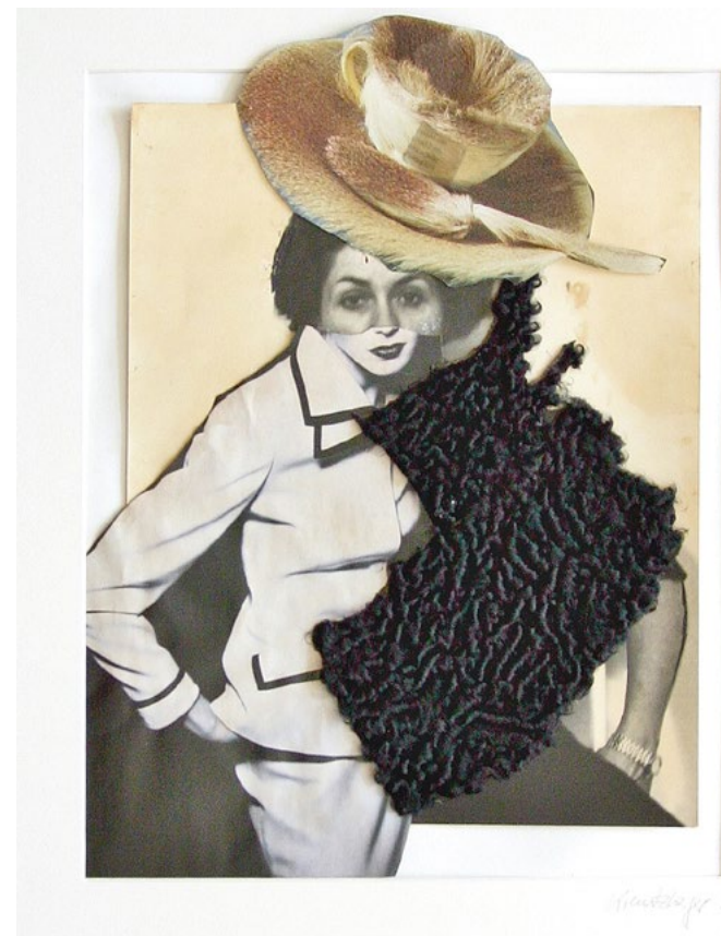
Aus der Serie Großmutter Persianer: Gut behütet - über den Rahmen II 2006 · Collage, Mischtechnik, Pelz auf Fotopapier · 60 x 50 cm

Das sichtbare Kostüm in schwarz-weiß erinnert an Kostüme der 20iger Jahre des 20. Jhd.s und stellt neben dem Persianerpelz dadurch einen direkten Bezug zu den Auftritten Ida Dehmels in den Salons Hamburgs und Berlins der 20iger Jahre her.